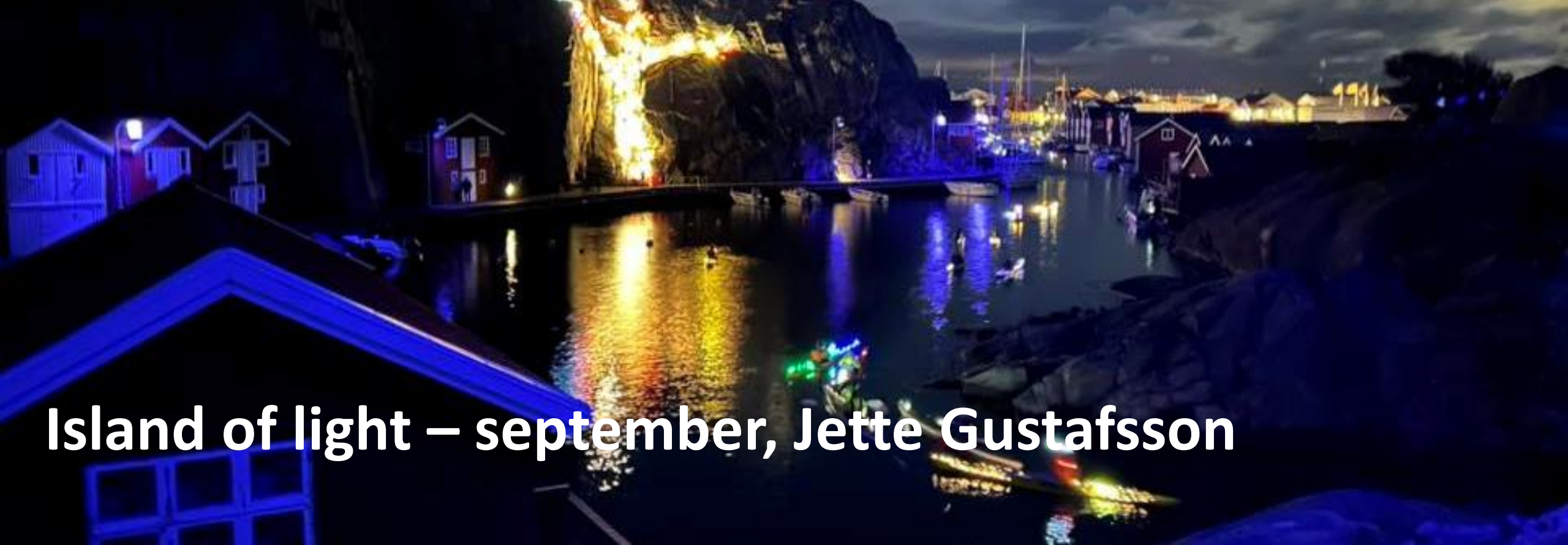
Island of light – september, Jette Gustafsson